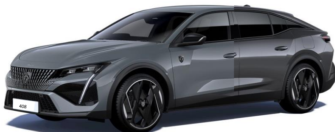
Sivá SELENIUM / Sivá TITANE (3)