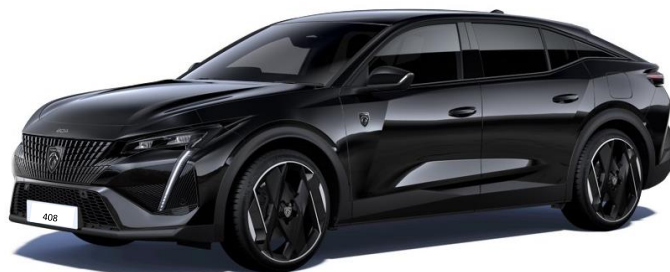
Čierna PERLA NERA