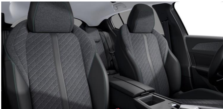
ALLURE, ALLURE PACK - štandardný poťah FRACTIL (U3FX)