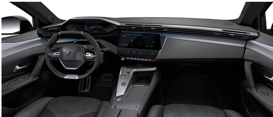
GT - palubná doska s chrómovým dekorom a zeleným prešívaním