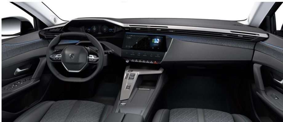
ALLURE / ALLURE PACK - palubná doska s dekorom TEXA