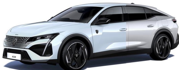
Biela OKENITE / Biela NACRÉ (3)