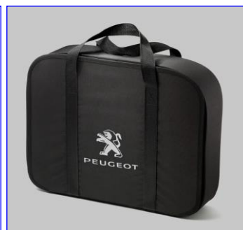
Taška na nabíjacie káble Peugeot 98 493 006 80