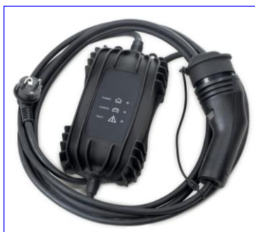
Štandardný kábel pre zapojenie do domácej 230V zásuvky 98 467 444 80