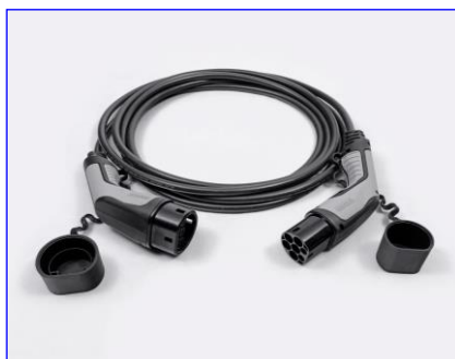
Kábel režimu 3 pre pripojenie do nabíjacej stanice (domáceho WallBoxu alebo verejnej stanice)