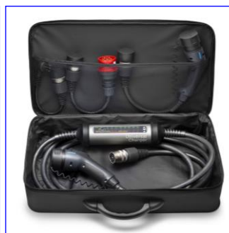
Súprava s nabíjacou jednotkou pre zapojenie do viacerých druhov elektrickej siete (230V/400V/WallBox) 98 460 313 80